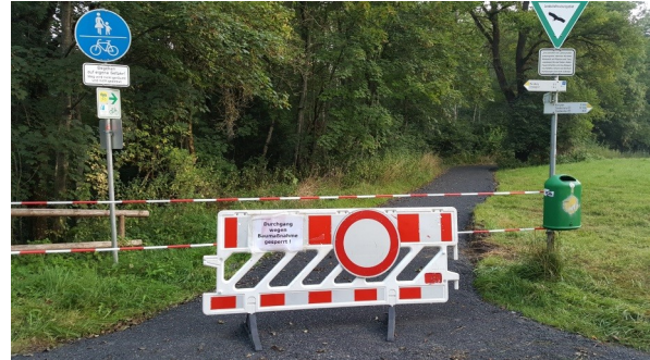
Kurz vor Abschluss der Arbeiten: Neuer Belag ist schon drauf

Auf dem neuen Belag lässt es sich gut radeln. Vielen Dank an die Stadt Kempten und die Mitarbeiter des Städtischen Betriebshofes.