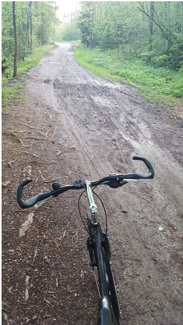
Vor der Sanierung: Eine Schlammrinne

Zuvor war der Radweg nach Regen immer mehrere Tage lang verschlammt.